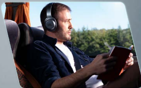
Manutenção facilitada, visando a continuidade da operação.