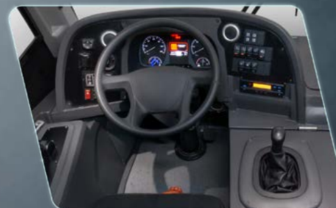
Controle de funções da carroceria por teclas.