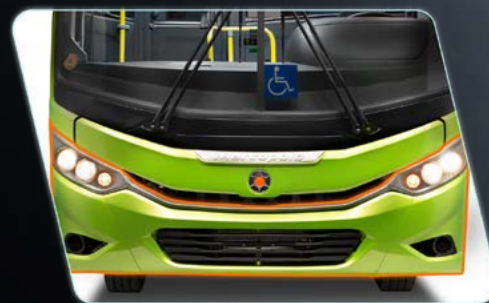
Acionamento da grade dianteira por pistão.