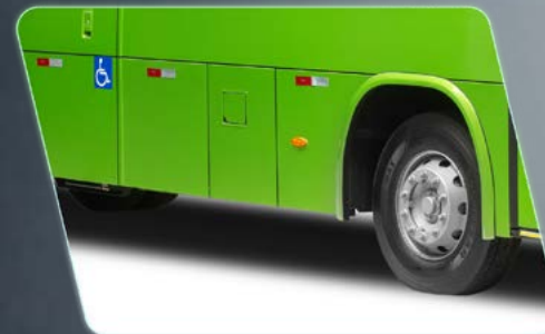
Conceito de saia reta.