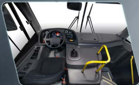
Maior espaço para o motorista.