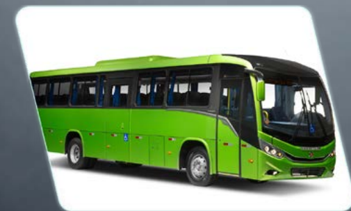
Robustez com design da Geração 8.