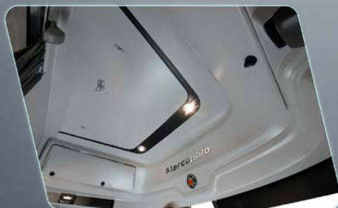
Melhor isolamento termoacústico do capô e cabine.