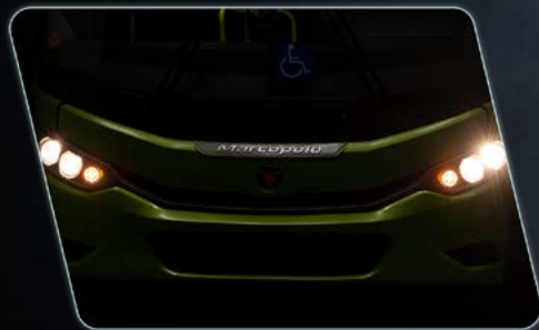
Conjunto óptico independente.

Voltado ao segmento de fretamento e linha, o Viaggio 800 prioriza robustez e entrega desempenho operacional. Com interior e exterior remodelados e largura de 2.600mm, proporcionam mais conforto ao passageiro e praticidade de manutenção.