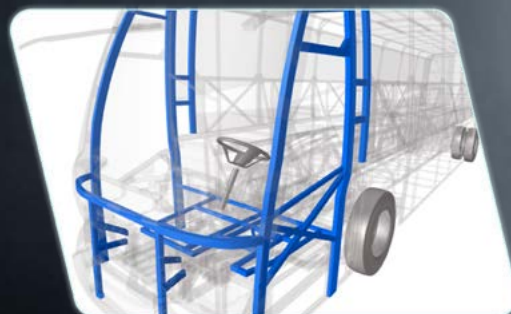
Célula de sobrevivência do motorista. (Opcional)