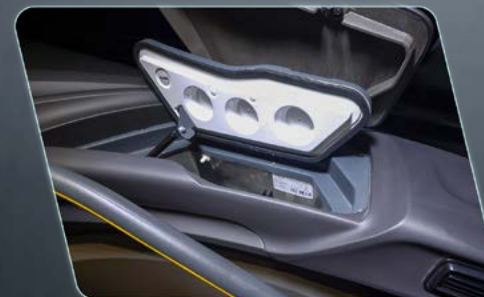
Geladeira embutida no painel, gerando praticidade ao condutor (opcional).