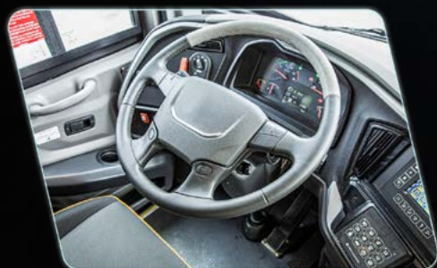
Remodelamento do posto do motorista, proporcionado maior visibilidade ao condutor.