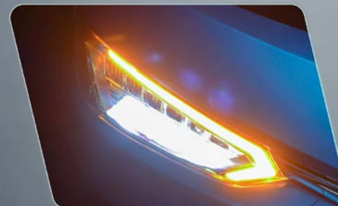
Conjunto ótico aprimorado, com faróis de longa distância e luz de manobra.