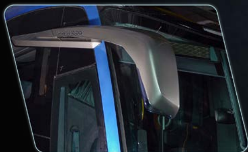
Visibilidade do espelho retrovisor ampliada.