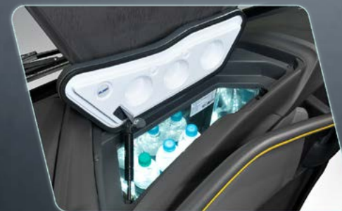
Geladeira embutida no painel, gerando praticidade ao condutor (opcional).