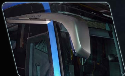
Visibilidade do espelho retrovisor ampliada.