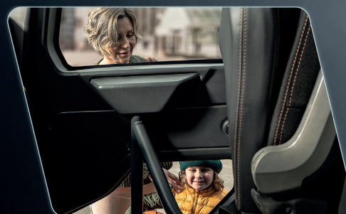
Área translúcida na porta possibilita a visualização de obstáculos na lateral do veículo.