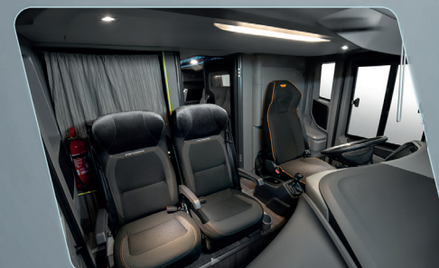
Maior espaço na cabine.