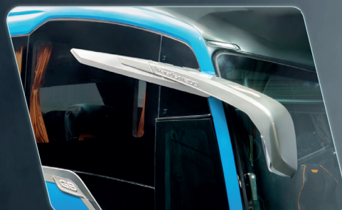
Visibilidade do espelho retrovisor ampliada.