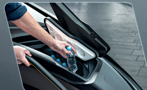
Geladeira embutida no painel, gerando praticidade ao condutor (opcional).