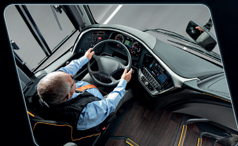
Remodelamento do posto do motorista, proporcionado maior visibilidade ao condutor.