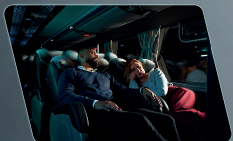
Sistema de renovação de ar em ambos os pisos.