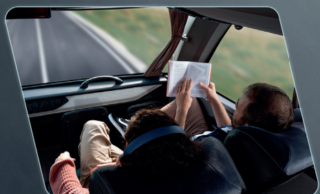
Visão privilegiada da paisagem.