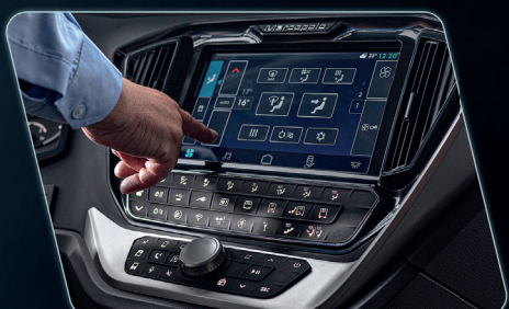
Centrais elétricas padronizadas facilitam a identificação de componentes.