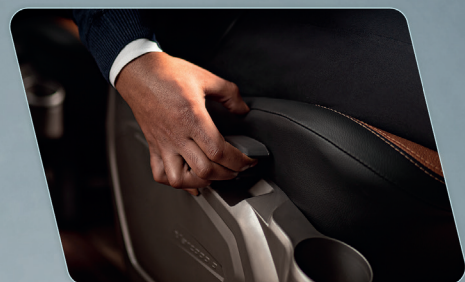
Poltronas com novo sistema por pistão, com reclinção suave e fácil acesso e manutenção.