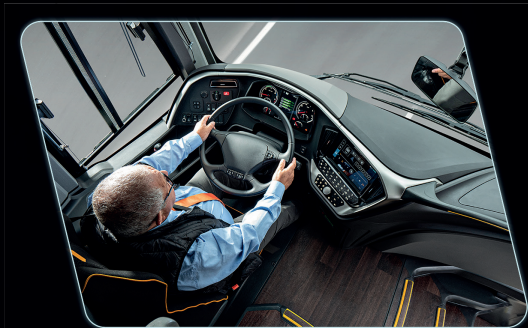
Remodelamento do posto do motorista, proporcionando maior visibilidade ao condutor.