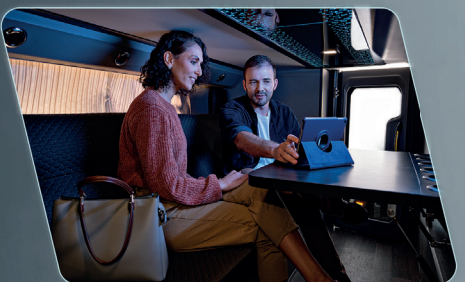
Porta-pacotes com maior espaço disponível para bagagem.