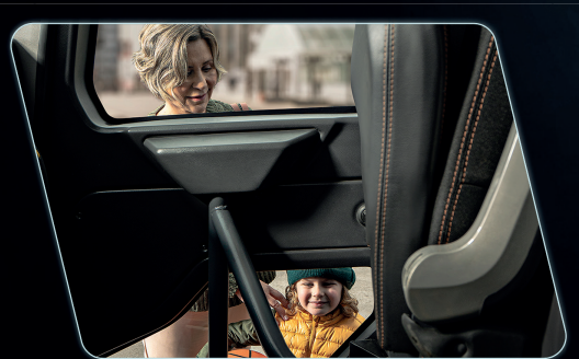
Área translúcida na porta possibilita a visualização de obstáculos na lateral do veículo.