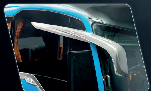
Visibilidade do espelho retrovisor ampliada.