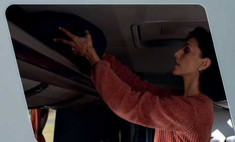
Porta-pacotes: iluminação decorativa na lateral e mais espaço disponível para bagagem.