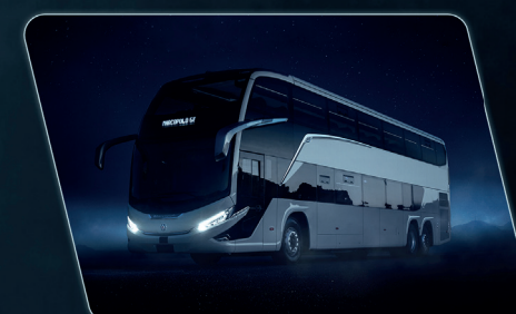
Design moderno e aerodinâmico que se reverte em menor consumo de combustível.