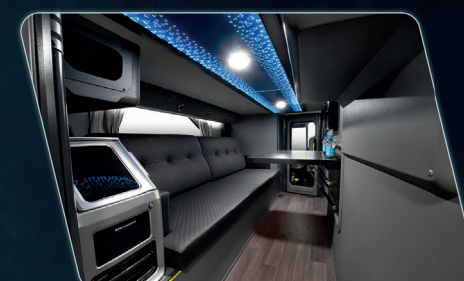
Customização do espaço sobre o rodado dianteiro, podendo ser utilizado como sala de estar, bagageiro ou camarote para o motorista.