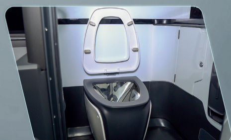
Sanitário mais amplo e iluminado, contando com sistemas para desinfecção por UV-C.