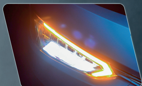
Sistema eletrônico com controle integrado a Head Unit.