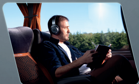
Vidros curvos, diminuindo a vibração no salão de passageiros.