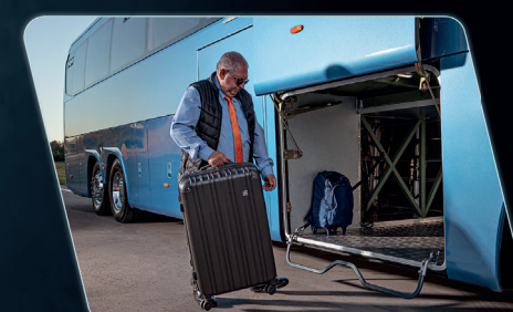
Ampla capacidade do bagageiro, com compartimentos sobre os rodados dianteiro e traseiro.