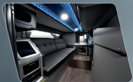
Iluminações decorativas no teto do piso inferior e lateral do porta-pacotes.