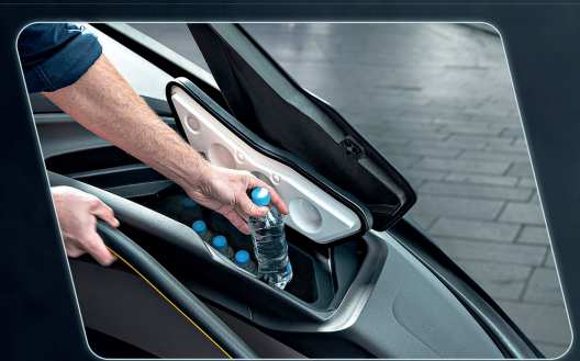
Possibilidade de adição de geladeira ao lado do motorista, gerando praticidade ao condutor.