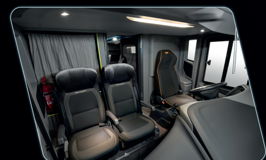
Maior espaço na cabine.