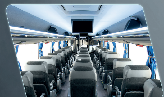
Porta-pacotes: iluminação decorativa na lateral e mais espaço disponível para bagagem.