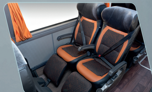
Poltronas com novo sistema por pistão, com reclinção suave e fácil acesso e manutenção.