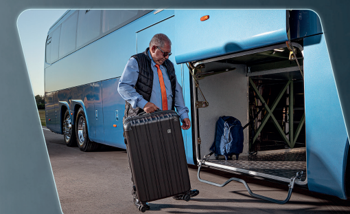
Ampla capacidade de bagageiro, com compartimentos sobre os rodados dianteiro e traseiro.