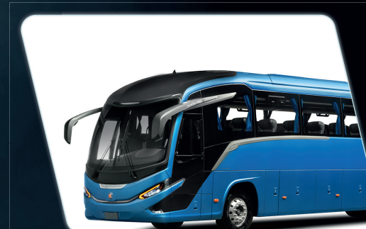
Design moderno e aerodinâmico que se reverte em menor consumo de combustível.