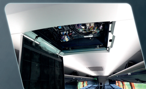
Centrais elétricas padronizadas facilitam a identificação de componentes.