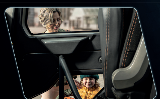
Área translúcida na porta possibilita a visualização de obstáculos na lateral do veículo.