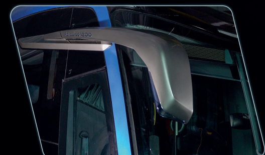
Visibilidade do espelho retrovisor ampliada.