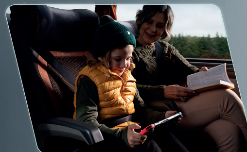
Estrutura modelada e simulada para deformação programada, proporcionando mais segurança aos ocupantes.