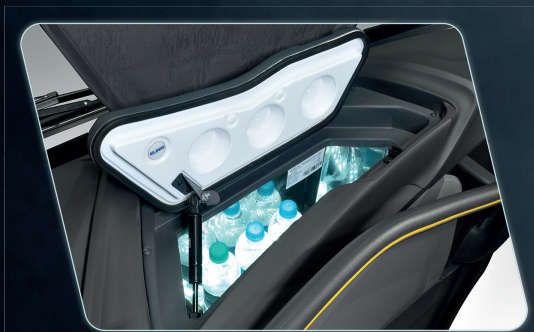
Geladeira embutida no painel, gerando praticidade ao condutor (opcional).