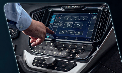
Sistema eletrônico com controle integrado à Head Unit.