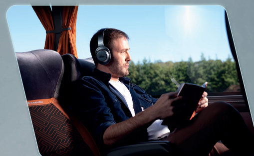
Vidros curvos, diminuindo a vibração no salão de passageiros.