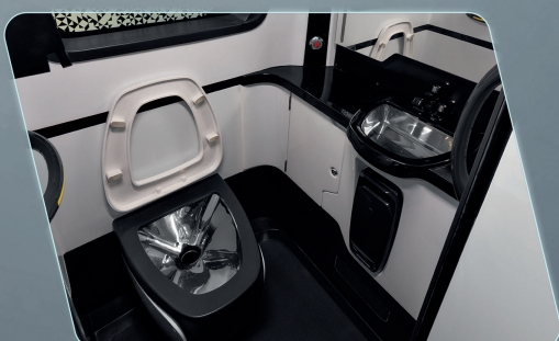
Sanitário mais amplo e iluminado, contando com sistemas para desinfecção por UV-C.