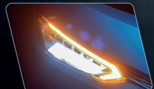
Conjunto ótico aprimorado, com faróis de longa distância e luz de manobra.