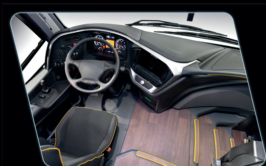
Remodelamento do posto do motorista, proporcionando maior visibilidade ao condutor.