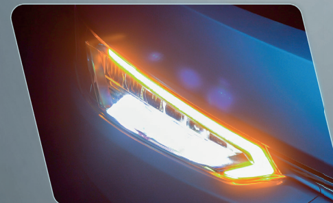
Conjunto ótico aprimorado, com faróis de longa distância e luz de manobra.