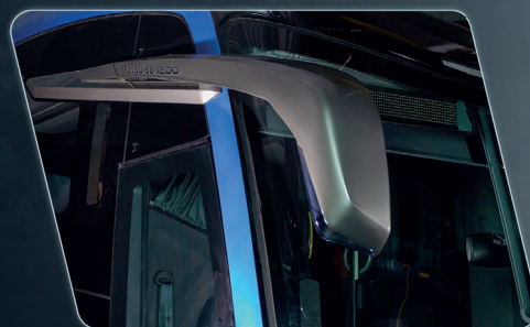
Visibilidade do espelho retrovisor ampliada.