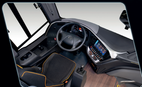
Remodelamento do posto do motorista, proporcionado maior visibilidade ao condutor.