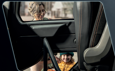
Área translúcida na porta possibilita a visualização de obstáculos na lateral do veículo.