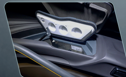
Geladeira embutida no painel, gerando praticidade ao condutor (opcional).