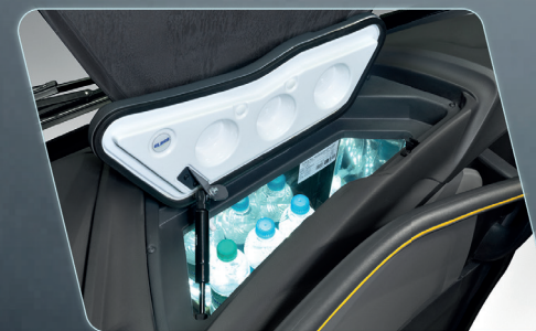
Geladeira embutida no painel, gerando praticidade ao condutor (opcional).