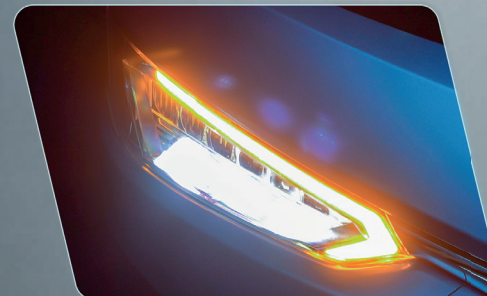
Conjunto ótico aprimorado, com faróis de longa distância e luz de manobra.