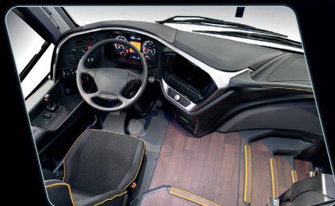
Remodelamento do posto do motorista, proporcionado maior visibilidade ao condutor.